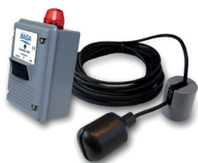
RSK nr. 563 2673

En nivåvipa styr larmenheten. Vid larmsignal avger BLS enheten både ljud och ljuslarm. Nätanslutning.