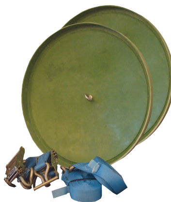
RSK nr. 563 6122

Tankar över 4m 3 förankras med jordankare. Ett set består av 2 st. Ø 600 mm glasfiberlock med 1 st förankringsband 8 m. Se monteringsanvisningar för antal förankringsset per tank.