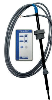
RSK nr. 563 2672

Larmet som arbetar konduktivt är avsett för avloppsvatten eller andra elektriskt ledande vätskor. Alarm ges när givarens båda elektroder omges av vätskan. Batteridrift.