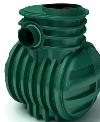
Kingspan NSF oljeavskiljare med koalecensfilter, integrerat slamfång och automatisk avstängningsventil.