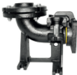
Kopplingsfot med glidsko